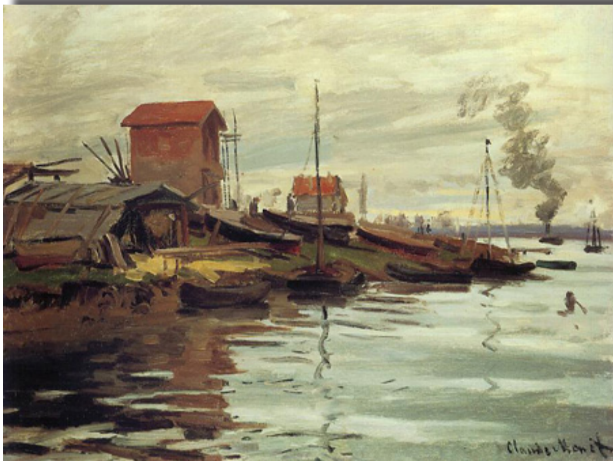
Peinture de Claude Monet

À la fin du XIXe siècle, de nombreux impressionnistes (Cézanne, Monet, Berthe Morisot, Renoir, Alfred Sisley et Van Gogh entre autres) fréquentèrent Gennevilliers où habitaient la famille Manet et le peintre Gustave Caillebotte. Ils y peignirent de nombreux tableaux.