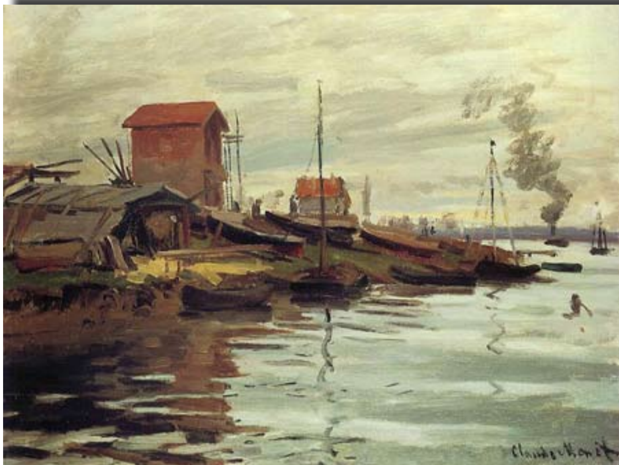
Peinture de Claude Monet

À la fin du XIXe siècle, de nombreux impressionnistes (Cézanne, Monet, Berthe Morisot, Renoir, Alfred Sisley et Van Gogh entre autres) fréquentèrent Gennevilliers où habitaient la famille Manet et le peintre Gustave Caillebotte. Ils y peignirent de nombreux tableaux.